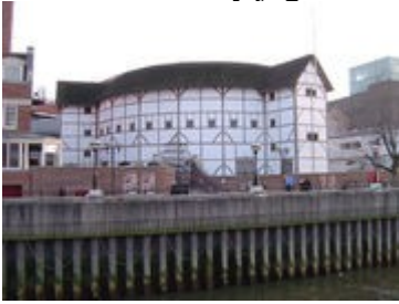
Odnawiany Globe Theatre

Globe Theatre: teatr w Londynie działający w latach 1599-1642, jednym z udziałowców był William Shakespeare, po pożarze w 1613 roku teatr został odbudowany. Tego typu budynki teatralne zbudowane były na planie okręgu, zapewniało to lepszą akustykę. Nie posiadały dachu, dzięki czemu wykorzystywać mogły naturalne oświetlenie, z drugiej strony spektakle mogły się odbywać tylko w dni bezdeszczowe. Kiedy aktorzy chcieli przedstawić scenę, która rozgrywa się nocą, wnoszono pochodnie, sugerując, że zmrok już zapadł. W teatrach nie było wtedy jeszcze rozbudowanych dekoracji ani kurtyny. Podobnie jak w teatrze antycznym, na scenie nie występowały kobiety, aktorami byli wyłącznie mężczyźni i oni odtwarzali wszystkie postacie. (Friends 3, unit 21)