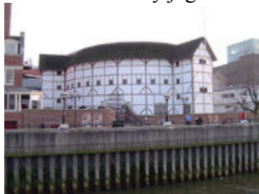
Odnawiany Globe Theatre

Globe Theatre: teatr w Londynie działający w latach 1599-1642, jednym z udziałowców był William Shakespeare, po pożarze w 1613 roku teatr został odbudowany. Tego typu budynki teatralne zbudowane były na planie okręgu, zapewniało to lepszą akustykę. Nie posiadały dachu, dzięki czemu wykorzystywać mogły naturalne oświetlenie, z drugiej strony spektakle mogły się odbywać tylko w dni bezdeszczowe. Kiedy aktorzy chcieli przedstawić scenę, która rozgrywa się nocą, wynoszono pochodnie, sugerując, że zmrok już zapadł. W teatrach nie było wtedy jeszcze rozbudowanych dekoracji ani kurtyny. Podobnie jak w teatrze antycznym, na scenie nie występowały kobiety, aktorami byli wyłącznie mężczyźni i oni odtwarzali wszystkie postacie.