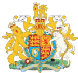
Godło Wielkiej Brytanii

RSPCA (Royal Society for the Prevention of Cruelty to Animals - Królewskie Towarzystwo Opieki nad Zwierzętami, Królewskie Towarzystwo Zapobiegania Okrucieństwu wobec Zwierząt)