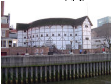
Odnawiany Globe Theatre

Globe Theatre: teatr w Londynie działający w latach 1599-1642, jednym z udziałowców był William Shakespeare, po pożarze w 1613 roku teatr został odbudowany. Tego typu budynki teatralne zbudowane były na planie okręgu, zapewniało to lepszą akustykę. Nie posiadały dachu, dzięki czemu wykorzystywać mogły naturalne oświetlenie, z drugiej strony spektakle mogły się odbywać tylko w dni bezdeszczowe. Kiedy aktorzy chcieli przedstawić scenę, która rozgrywa się nocą, wynoszono pochodnie, sugerując, że zmrok już zapadł. W teatrach nie było wtedy jeszcze rozbudowanych dekoracji ani kurtyny. Podobnie jak w teatrze antycznym, na scenie nie występowały kobiety, aktorami byli wyłącznie mężczyźni i oni odtwarzali wszystkie postacie.